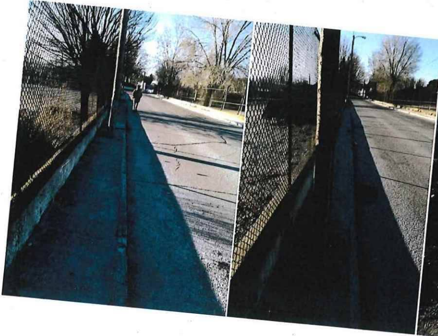
Acera estrecha y con obstáculos